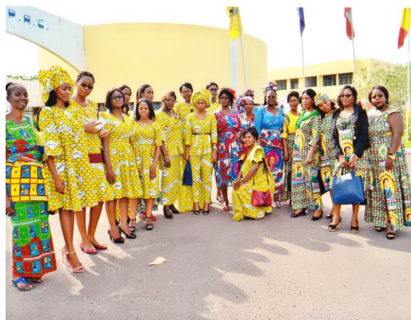
Photo de famille des participantes à la Journée internationale de la femme au CIESPAC

Conseils aux Femmes Victimes de Violences