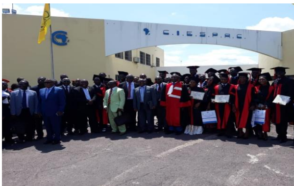
Photo de famille de la cérémonie de remise des diplômes aux lauréats de la première promotion

Treize (13) en Gestion des Programmes de lutte contre les Endémo-Epidémies (GPPE) ont mérité les mentions ci-après :