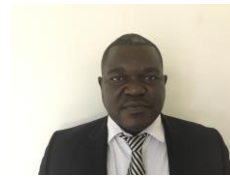
GUINANBEYE Langarsou Tchad