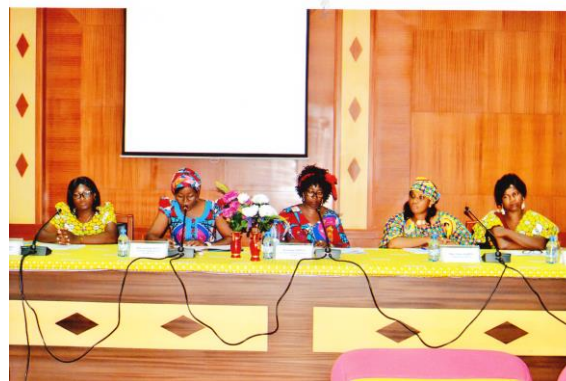
Panel du 08 mars 2019 au CIESPAC

Malgré ces conventions, la violence faite aux femmes sous toutes ses formes perdure.