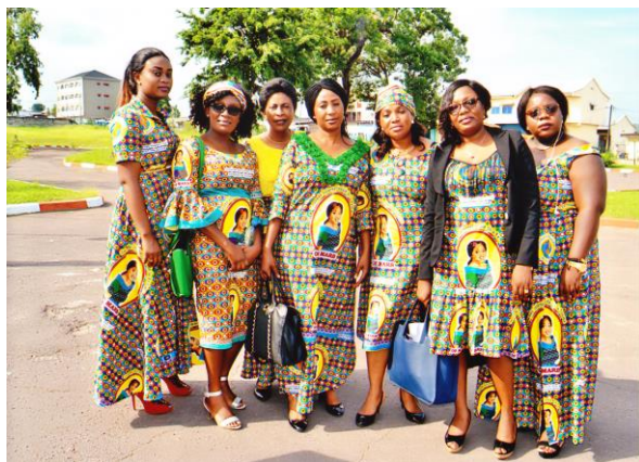
Femmes apprenantes en Cours du soir du CIESPAC