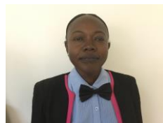
MANGUE Toningar Tchad