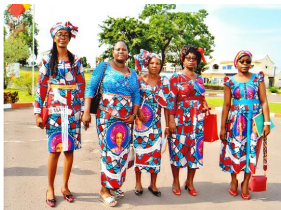
Personnel féminin du CIESPAC