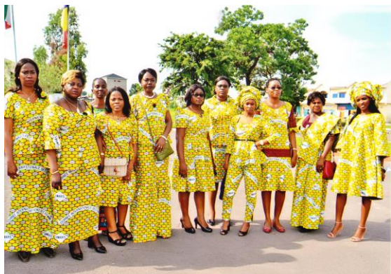
Femmes apprenantes en Cours du jour du CIESPAC